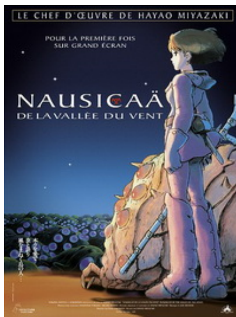
Affiche française, sortie en France en 2006.