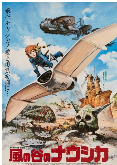
Affiche japonaise, Studio Ghibli, 1984

Observez attentivement l'affiche japonaise et l'affiche française du film Nausicaä de la vallée du vent .