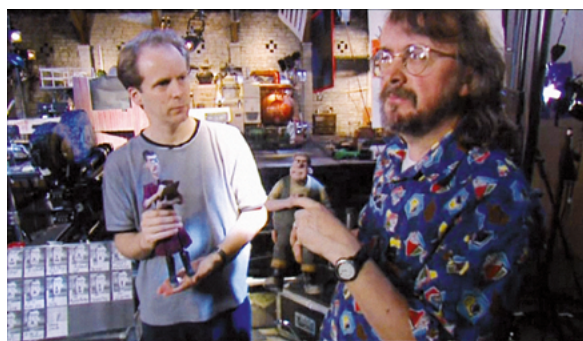
Peter Lord et Nick Park sur le tournage de Chicken Run en 1999

Nick Park et Peter Lord, les réalisateurs de Chicken Run , sont les deux artistes les plus admirés d'un des plus célèbres studios de cinéma d'animation du monde : Aardman, en Angleterre. Leurs personnages vivent grâce à la technique de la claymation : modelés dans une pâte nommée plasticine, ils sont animés en « stop motion », image par image. Parmi eux, un bricoleur génial et son chien, les célèbres Wallace et Gromit ( Une grande excursion , 1989), ont fait le tour du monde et ont rapporté deux Oscars à leur créateur Nick Park ( Un mauvais pantalon , 1993, et Rasé de près , 1995). L'Avis des animaux , court métrage où des bêtes enfermées dans un zoo disent leur désir de retrouver leur milieu naturel, avait connu le même succès en 1989. Premier long métrage du studio, né après plus de quatre années de travail, Chicken Run annonçait en 2000 ses grands titres du 21 e siècle : Pirates ! Bons à rien, mauvais en tout (2012), Shaun le mouton (2015 puis 2019) ou Cro Man (2018). Ginger et Rocky ont eu une brillante descendance !