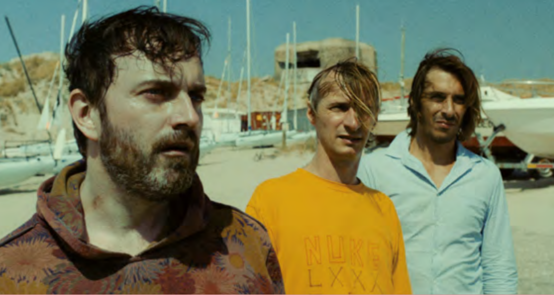
Jusqu'à l'os de Sébastien Betbeder