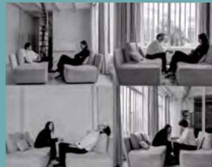
Le Film de l'absence de Frank Smith

Nous ouvrons cette nouvelle section compétitive pour mettre en lumière des films de moyen métrage, que ce soit des films de fiction ou documentaire, des films-essais ou des vidéos d'artistes, dans tous les cas des films de cinéma. Pas toujours destinés à une sortie en salle, ces films artistiquement ambitieux dans lesquels bourgeonnent de grandes questions sur le monde à venir, sont des balbutiements de l'esthétique de demain, des esquisses des sociétés futures.