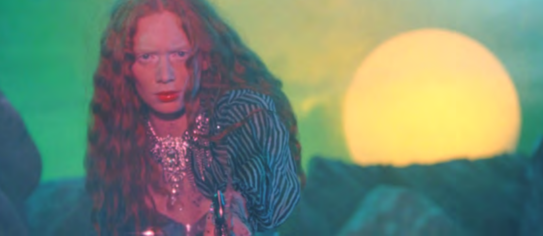
Extazus de Bertrand Mandico