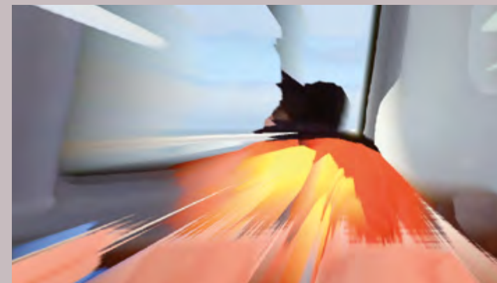
Vers Syracuse de Patrick Bokanowski

Il fait nuit à Shenzhen, des peintres copistes racontent leur quotidien et leur pratique. Leurs gestes empruntent autant à un imaginaire artistique qu'ouvrier, à des technologies récentes qu'à des techniques classiques. C'est une autre histoire de la peinture qui se dessine ici.