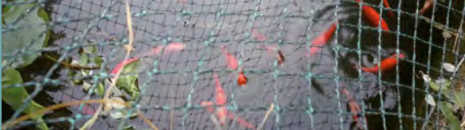
Faites des gosses de Marylène Negro