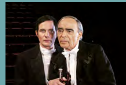
Felix in Wonderland de Marie Losier