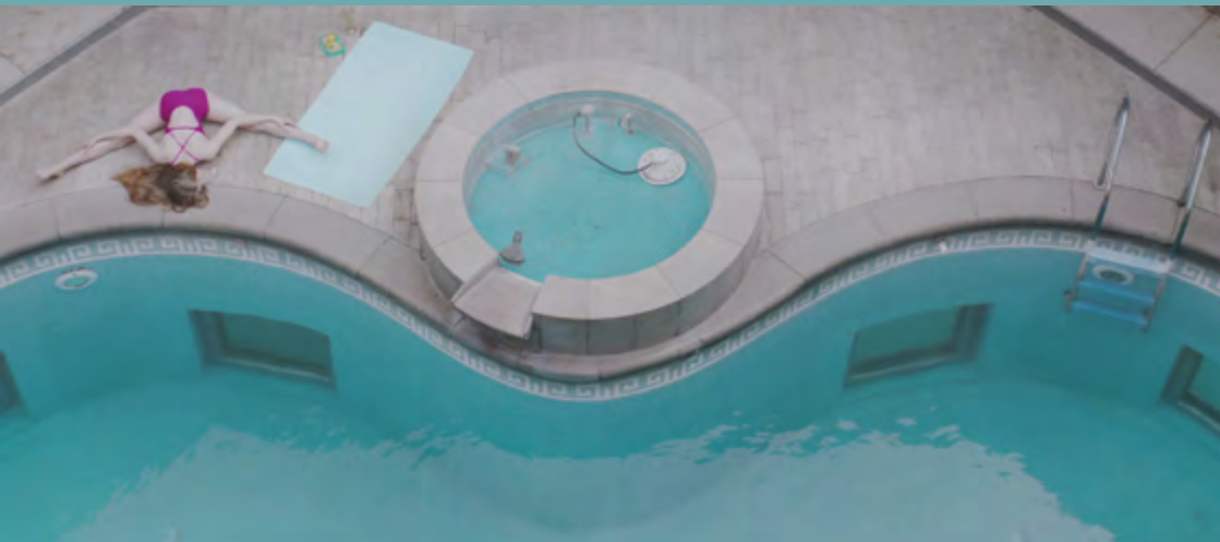
Electric Swan de Konstantina Kotzamani